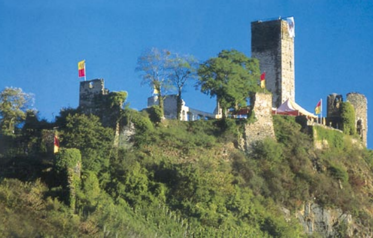
Burg Metternich in Beilstein