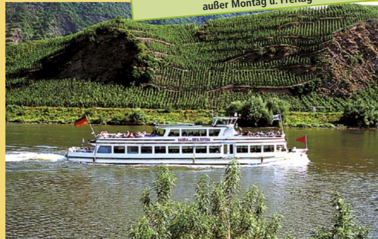
MS "Maria von Beilstein"

01. Mai bis 24. Juni / 06. bis 20. Juli u. 03. bis 28. Okt. Dienstag, Donnerstag u. Samstag 22. Juli bis 01. Oktober täglich außer Montag u. Freitag